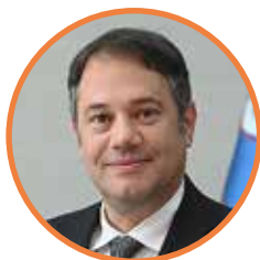
Matej Arčon, minister za Slovence v zamejstvu in po svetu