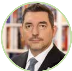
Pozdravne besede v imenu častne pokroviteljice: Aleš Musar , soprog predsednice RS