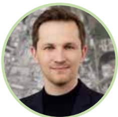
Matija Kovač , župan Občine Celje